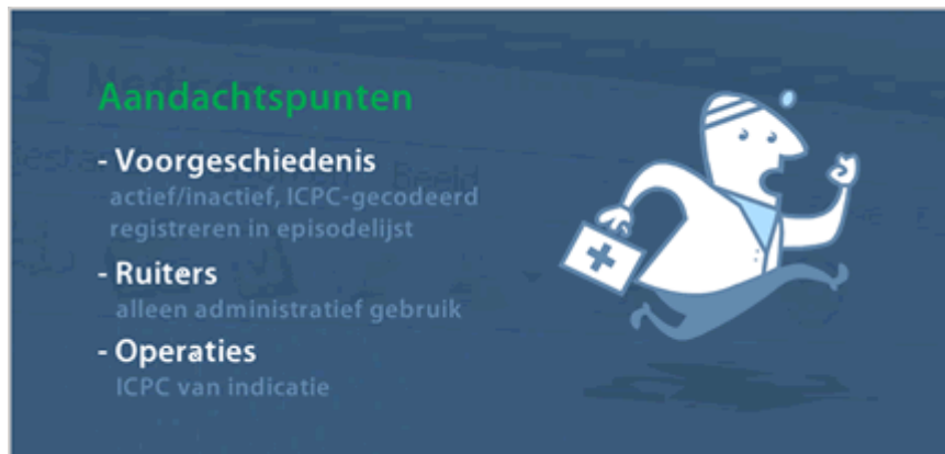
Een scherm uit de theorieles

De training start met een theorieles. Hierin maken de praktijkmedewerkers op een prettige en begrijpelijke manier kennis met de basisprincipes van de ADEMD-richtlijn. Waar dat relevant is, wordt het bijbehorende scherm van Medicom Nieuw getoond.